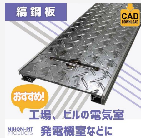
縞鋼板 (チェッカープレート)